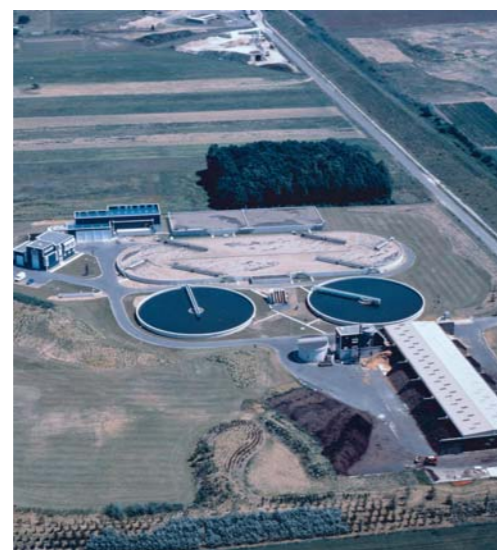
Station de Blois (France) Procédé ALIZAIR®

OXYREG® est une technique originale permettant d'ajuster instantanément et précisément la concentration du chlore injecté dans les tours de lavage. Elle s'appuie sur un système d'analyse optique (brevet Veolia Water Solutions & Technologies et SECOMAM) qui contrôle en continu la teneur en chlore des eaux de lavage. La quantité globale de réactifs utilisée s'en retrouve réduite et les rendements épuratoires accrus.