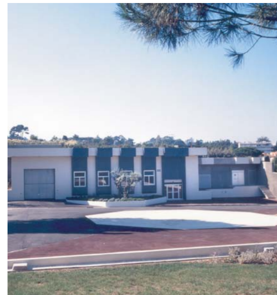
Station d'Antibes (France) Procédé AQUILAIR®

Fort de son expérience en désodorisation sur lit de tourbe, VEOLIA WATER SOLUTIONS & TECHNOLOGIES a développé l'emploi de matériau minéral permettant d'augmenter considérablement les performances du procédé. ALIZAIR® peut ainsi atteindre de très grandes vitesses de filtration (500 m/h) avec des charges épuratoires pouvant dépasser 50 g/h/m 3 de matériau.