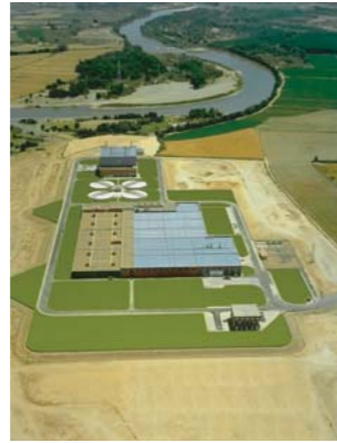
Station de Saragosse (Espagne) Procédé AQUILAIR®