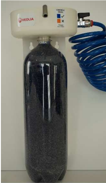
avec équerre murale PVC de fixation

Production eau déminéralisée type 2 > 10 MΩ.cm