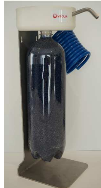
avec option TOLE SUPPORT INOX 316L PRDISI343458