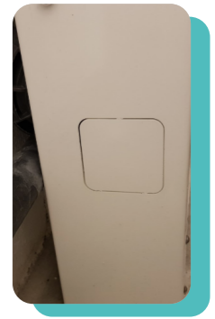
Opercul : passage tuyaux raccordement